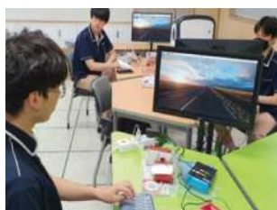
라즈베리 파이 실습