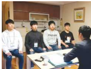
핵심 인재 취업 캠프(면접지도)