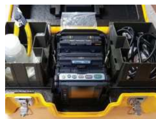
광케이블 유지 보수 실습