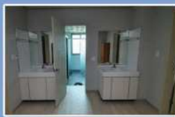
세면장 및 화장실