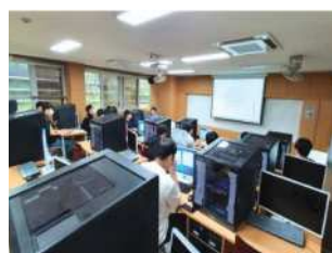
3D 프린팅 실습