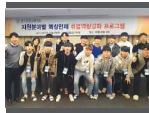
실전 취업 캠프